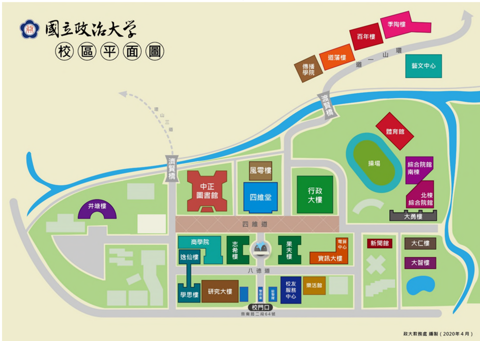
國立政治大學主要建築位置暨週邊道路圖 (校址：116011 臺北市文山區指南路二段 64 號)