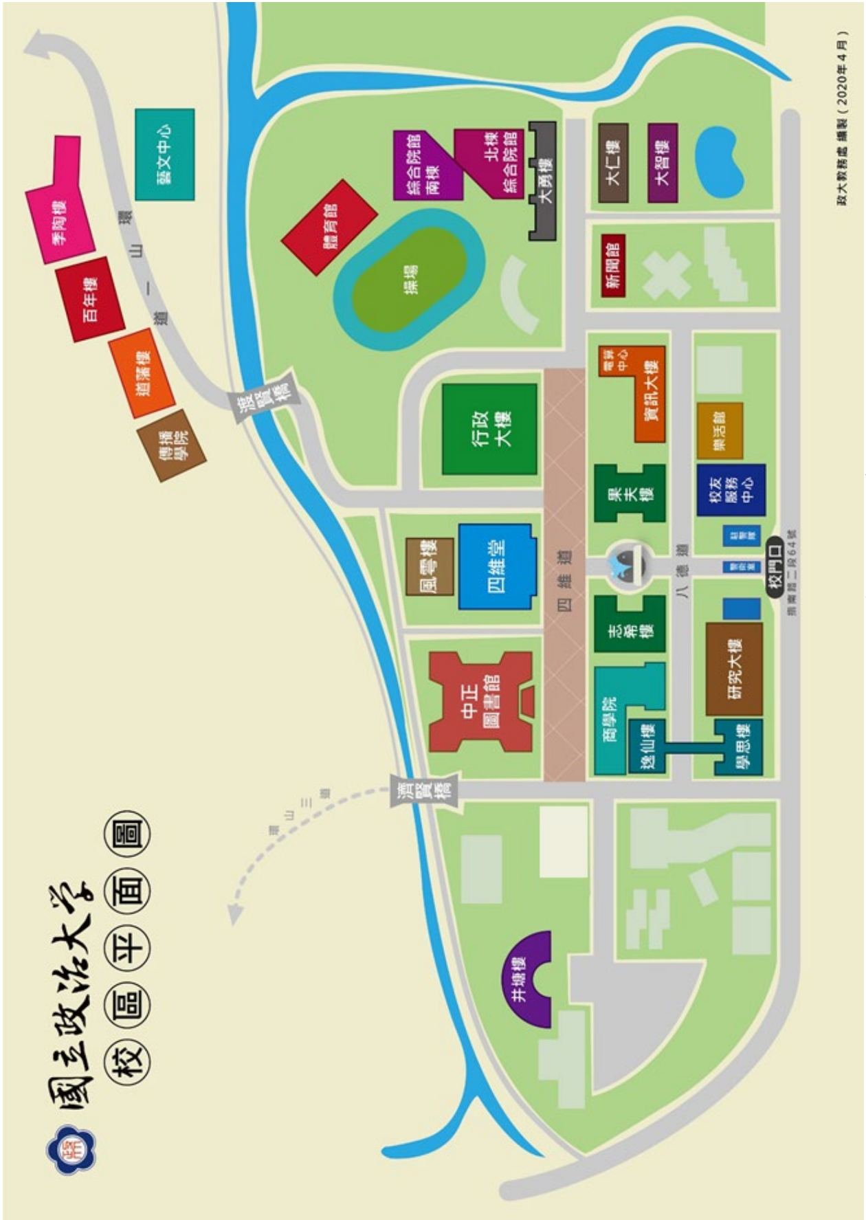
國立政治大學主要建築位置暨週邊道路圖 (校址：116011 臺北市文山區指南南路二段 64 號)